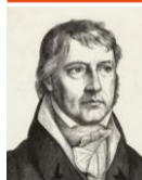
G.W.F. Hegel é considerado o pai da dialética moderna